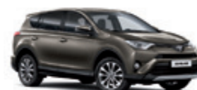
4T3 Бронзовий 2