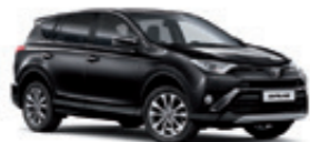
209 Чорний 2