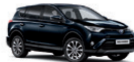
221 Темно-синій 2