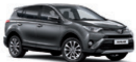
1G3 Сірий 2