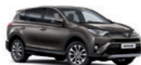
4U5 Темно-коричневий 2

Вся інформація, представлена у цьому матеріалі, є точною та дійсною станом на дату публікації 31.07.2017. Імпортер автомобілів Toyota залишає за собою право вносити зміни до інформації, наведеної в цьому матеріалі, без попереднього повідомлення.