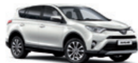
070 Білий перламутр 2