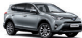
1D6 Сріблястий 2