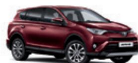
3T0 Темно-червоний 2