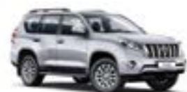
1F7 Сріблястий 3