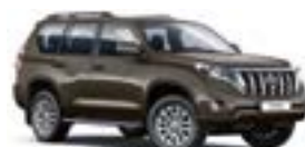
4T3 Бронзовий 3