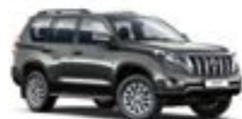
1G3 Сірий 3