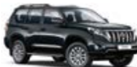
218 Чорний 3