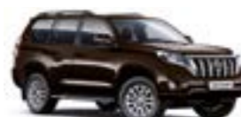
4X4 Коричневий 3

Вся інформація, представлена у цьому матеріалі, є точною та дійсною станом на дату публікації 01.09.2016. Імпортер автомобілів Toyota залишає за собою право вносити зміни до інформації, наведеної в цьому матеріалі, без попереднього повідомлення. Зовнішній вигляд автомобіля та його складових може відрізнятися від зображених у цьому матеріалі. Жодну частину цього матеріалу не може бути відтворено у будь-який спосіб без попереднього письмового дозволу правласника. 1 Ці дані отримано в ідеальних умовах без урахування манери водіння, дорожніх, погодних та інших умов, які впливають на витрату пального. Реальна витрата пального може відрізнятися від зазначеної і визначається лише експериментальним шляхом. 2 Розраховано за методом VDA. Мін. = всі сидіння піднято. Макс. = всі задні сидіння складено. 3 Колір металік або перламутр.