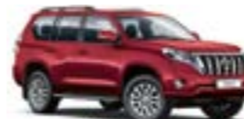
3R3 Червоний 3