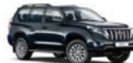
1H2 Темно-сірий 3