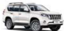
070 Білий перламутр 3